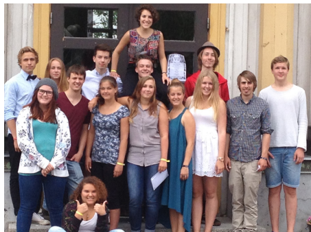
Förra årets gäng från Farsta